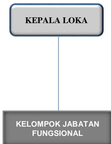
Gambar 1.2 Struktur Organisasi Loka POM